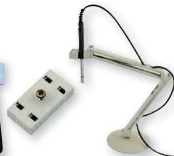
GEH 1 se snímačem

obj. č. 601091 magnetický držák pro přístroje s integrovanou opěrkou